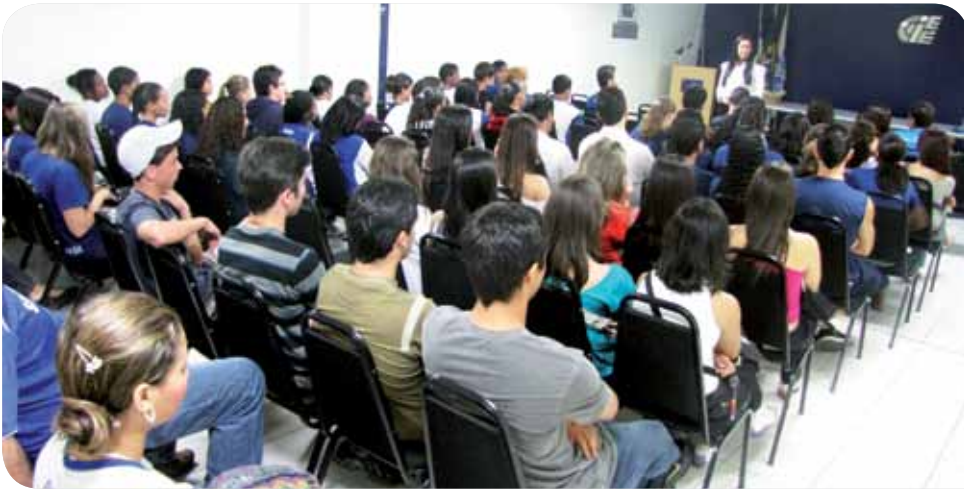
A programação do evento foi elogiada e atraiu grande número de estudantes, que lotaram o auditório do CIEE-ES

Em homenagem ao Dia do Estudante, comemorado em 11 de agosto, o CIEE-ES realizou a Semana do Estudante, com participação de 749 adolescentes e jovens. Com o tema “Mercado de Trabalho: Possibilidades x Escolhas”, a programação contou com atividades gratuitas voltadas para o desenvolvimento das potencialidades e habilidades dos jovens. O objetivo foi torná-los mais competitivos para a próxima etapa da vida: enfrentar o mercado profissional.