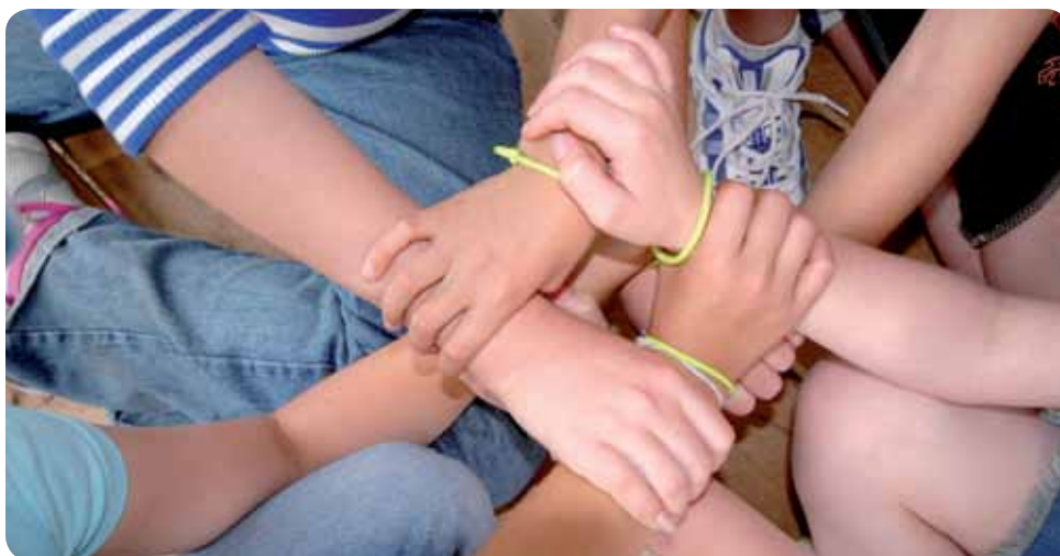
As contribuições capixabas podem chegar a R$ 46 milhões, mas só alcançaram R$ 795 mil em 2008